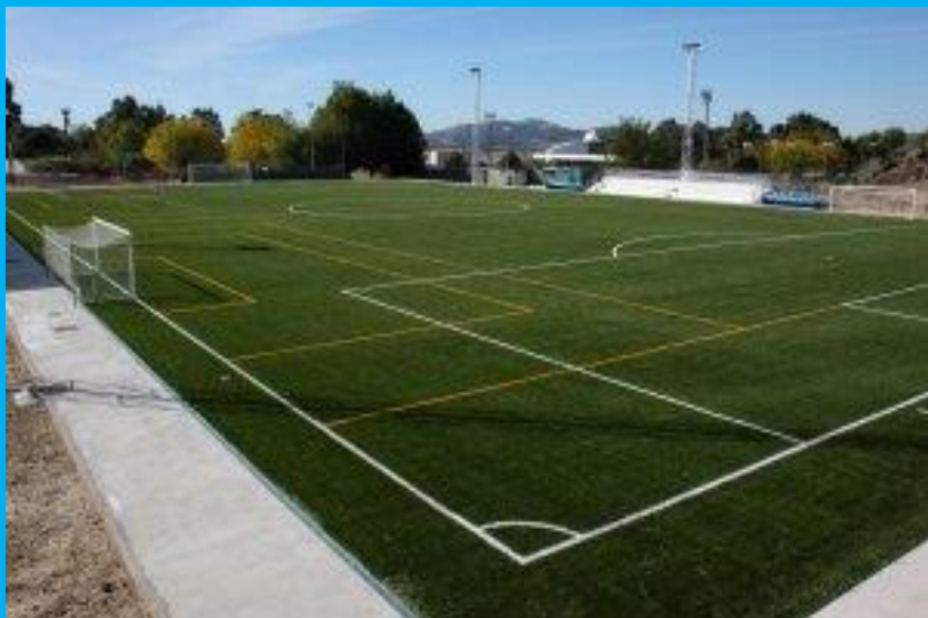
Campo de césped artificial Ciudad Deportiva