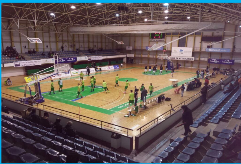
Pabellón Ciudad de Plasencia